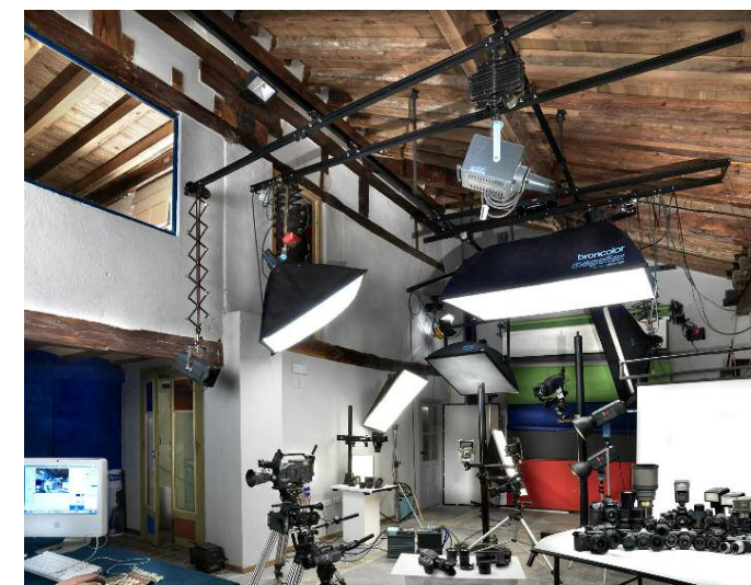
Interiores de la casa en la que se desarrolla el curso